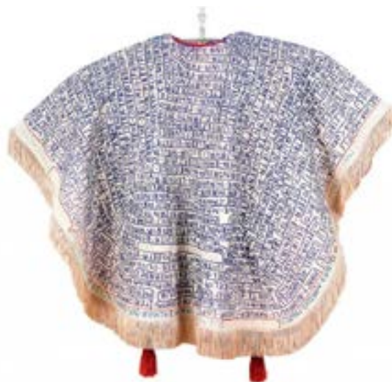
Arthur Bispo do Rosário Título atribuído: “Manto da apresentação – Verso” Coleção Museu Bispo do Rosário Arte Contemporânea