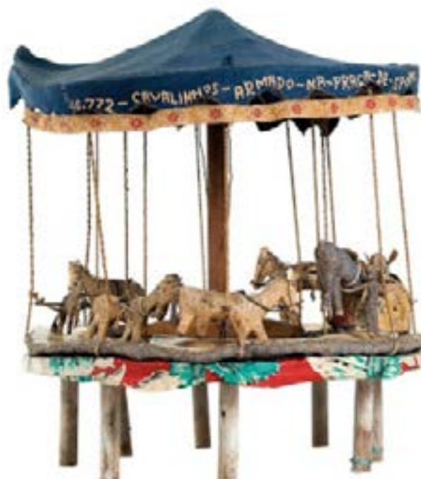
Arthur Bispo do Rosário Título atribuído: “Carrossel” Coleção Museu Bispo do Rosário Arte Contemporânea

A solidariedade fez chegar às centenas de milhares de desabrigados um grande volume de doações. Nesse cenário, o governador do Estado manifestou publicamente sua preocupação com os prejuízos que esse volume de donativos traria para os comerciantes gaúchos, sugerindo que as doações “físicas” geravam um problema, pois as pessoas deixariam de comprar... Muito criticado, desculpou-se.