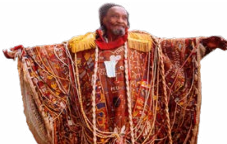
Arthur Bispo do Rosário Título atribuído: “Manto da apresentação” Coleção Museu Bispo do Rosário Arte Contemporânea