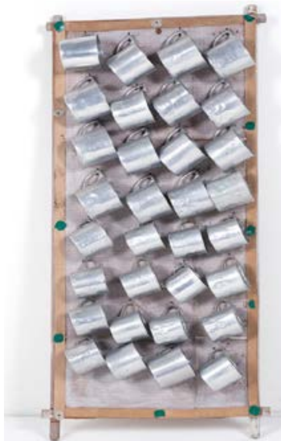
Arthur Bispo do Rosário Título atribuído: “Canecas” Coleção Museu Bispo do Rosário Arte Contemporânea

Foi em uma experiência de supervisão de psicólogas de uma instituição que acolhe mulheres vítimas de violência, quando tive a oportunidade de perceber o uso, como imperativo de época, que se pode fazer do significante “empoderamento”, e os efeitos violentos, sacrificiais, que o Discurso do Mestre, erguendo o significante “empoderamento” como S1, pode produzir no interior de parcerias amorosas. De fato, uma espécie de furor curandis de um eu débil, baseado na ilusão de um eu consistente, dono de si, e sem conflitos, fazia do empoderamento uma lei férrea que impregnava as intervenções das profissionais, apagando o sujeito do inconsciente. Assim, algumas mulheres eram tomadas por essas intervenções, que não estavam isentas de um dizer culpabilizante por trás dos ditos sobre os direitos femininos, nem sequer respeitados pelas próprias vítimas. Muitas destas mulheres ficaram expostas às respostas violentas dos seus parceiros amorosos – acima de tudo, as mulheres que, depois de retirada a denúncia que fize-