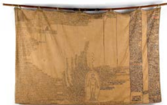
Arthur Bispo do Rosário Título atribuído: “Eu preciso destas palavras escrita” Coleção Museu Bispo do Rosário Arte Contemporânea